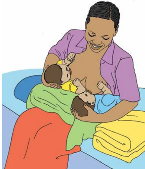
Mama anayenyonyesha mapacha Kushika vichwa vya watoto

Hufaa kwa watoto wadago sana hii ni namna ya ku mkamata mutoto wakati ya ku nyonyesha.