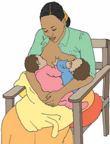
Mama anayenyonyesha mapacha Kupishanisha miguu